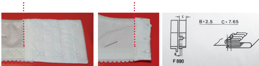
Produktmuster Hakenband Zick Zack Naht mit exakter Kantenführung für BH-Verschuß