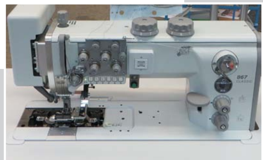
Zweinadelmaschine mit Messerantrieb