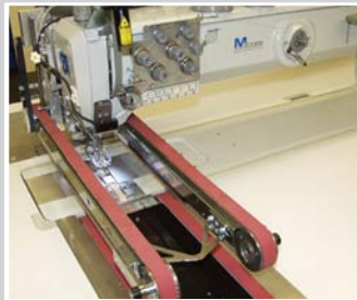
Endnäher Klein Zusatztransport für gerade Nähte montiert direkt an der Nähmaschine