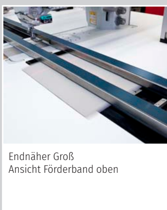
Endnäher Groß, Ansicht Förderband oben