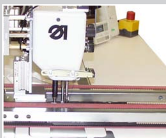
Endnäher Groß mit Band von unten und Guillotine