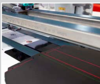
Endnäher Groß, Ansicht Förderbänder oben und unten