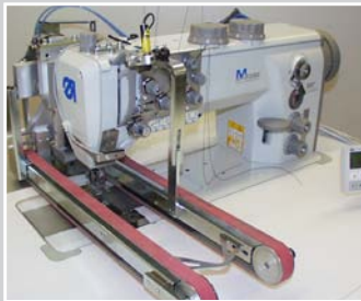
Endnäher Klein, an einer Zweinadel-Stepstichmaschine