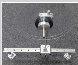
Bandrollenhalter verstellbar für Montage unter der Tischplatte