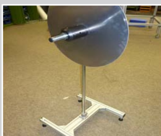
Bandrollenhalter mit Standfuß