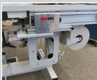
Bandrollenhalter seitlich ausfahr- bar mit integrierter Bandüber- wachung und Bandsponder für Montage unter der Tischplatte