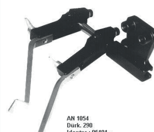
Hochschwenkbarer Anschlag mit zwei Anschätzen links der Nadel