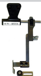
Hochschwenkbarer Anschlag für Leder. Für alle gängigen Nähmaschinenfabrikate