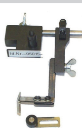
Hochschwenkbarer Anschlag für Leder. Für alle gängigen Nähmaschinenfabrikate