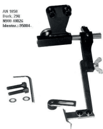
Hochschwenkbarer Anschlag für Leder. Für alle gängigen Nähmaschinenfabrikate