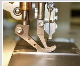
Stanzmesser an einer Flachbett- Hüpferttransport/Nähmaschine