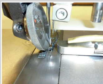
Stanzmesser an einer Flachbett/ Radtransport/Nähmaschine