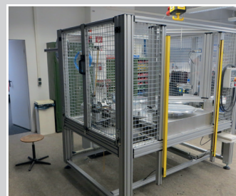
Klebeautomat zum Fertigen von Dichtungen