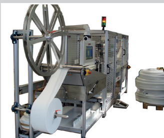
Nähautomat zum Fertigen von Sanierungsschläuchen