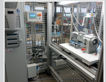
Nähautomat zum Fertigen von Wäschetrockner-Dichtungen