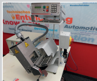
Heizklingenschneider 100 mm