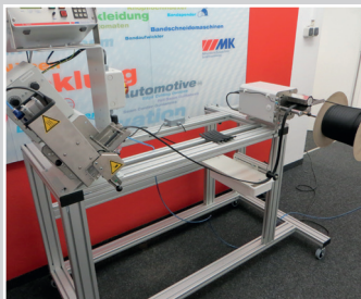
Schneidanlage, Heizklingenschneider 100 mm mit Bandspender auf Rollengestell