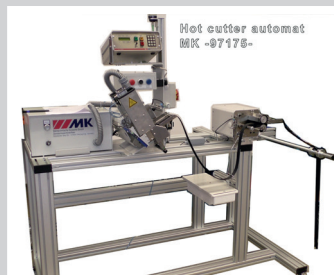
Schneidanlage, Heizklingenschneider 100 mm mit Bandspender auf Rollengestell