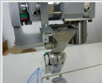
Heißluftmaschine mit Höhenausgleichsrolle