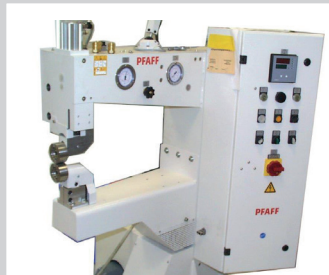
Armmaschine mit erhöhter Rolle