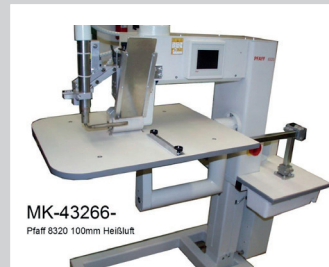
MK-43266- Pfaff 6320 100mm Heißluft