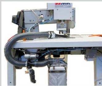
Ansicht von hinten - Absauger oberhalb der Tischkante