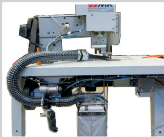
Ansicht von hinten - Absauger oberhalb der Tischkante