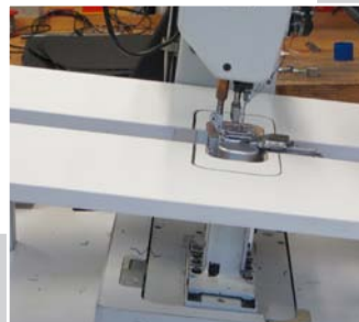
Maschine mit Y-OKE Führung