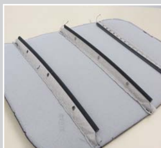
Nähmuster Bänder Y-OKE Leiste