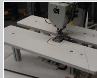
Y-OKE Leistenführung an einer Säulenmaschine