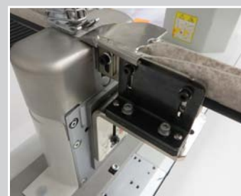
Y-OKE Leistenführung an einer Säulenmaschine