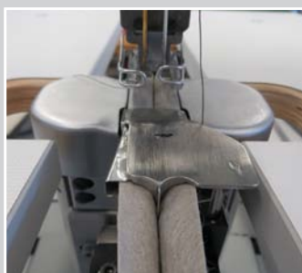
Y-OKE Führung vor der Nadel