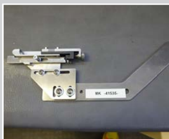
Paspelführung für verklebten Lederpaspel