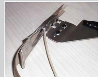
Paspelführung für offenen Lederpaspel mit Keder