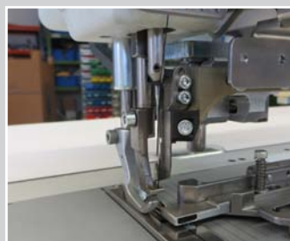
Paspelführungen Lederpaspel geklebt