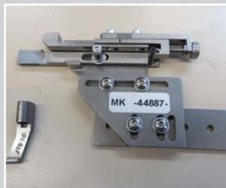
Paspelführung für verklebten Lederpaspel