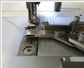
Paspelführung für verklebten Lederpaspel