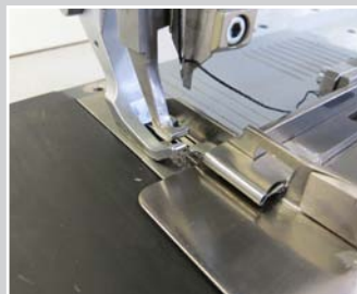
Paspelführung für offenen Lederpaspel