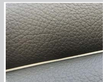
Nahtmuster: Eingenähter Lederpaspel