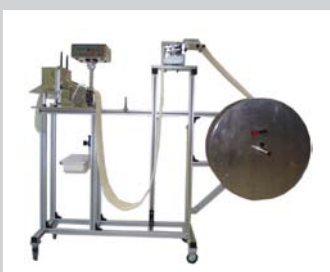
Bandschneideanlage 300 mm mit pneumatischer Schere und Bandspender auf Rollengestell