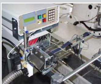
Bandschneidegerät 100 mm mit pneu- matischer Schere und Dicksensor, Ab- saugung, Tänzersteuerung für Schneiden von Güteltschlaufen