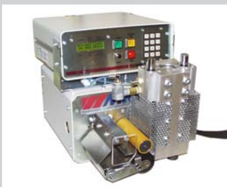
Bandschneidegerät 100 mm mit Lochstanze Schneiden