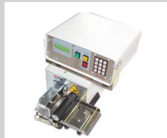
Bandschneidegerät 100/150 mm mit pneumatischer Schere