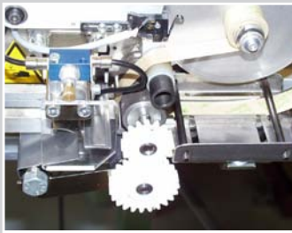
Spezielscheidegerät mit Deckfolien-Abzugsvorrichtung

Vielseitiges Zubehörprogramm wie z.B Fotozelle Banderkennung, Markiereinrichtungen, Lochstanzen , Stapler machen unsere Geräte universell einsetzbar. Gerne realisieren wir für Sie Sonderlösungen.