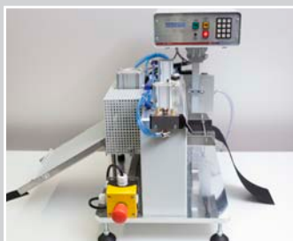
Bandschneidegerät 200 mm