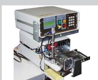
Zubehör Abstapelvorrichtung im Auslauf