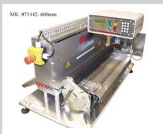
Bandschneidegerät 400/500/600 mm mit pneumatischer Guillotine