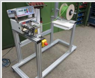
Bandschneidegerät 100 mm mit pneumatischer Schere zum Schneiden von Kederschnüren, auf Rollengestell