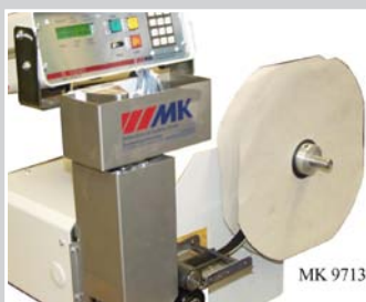
Bandschneidegerät 50 mm mit pneumatischer Schere 30° Schrägstellung