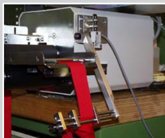
Schneidegerät mit Bandknoten-Stoppeinrichtung