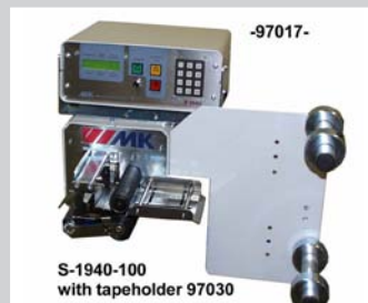
Bandschneidegerät 100/150 mm mit pneumatischer Schere und kleinem Bandrollenhalter