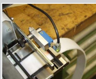
Zubehör Fotozelle für Banderkennung