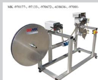
Bandschneidegerät 100/150 mm mit pneumatischer Schere auf Rollengestell