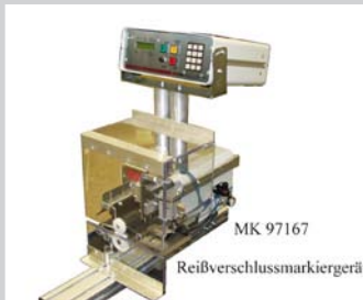
Schneideanlage 100 mm zum Schneiden und Markieren von Reißverschlüssen