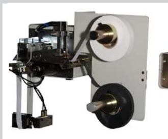
Bandschneidegerät 2x 40 mm mit pneumatischer Schere zum Schnei- den von zwei Bändern