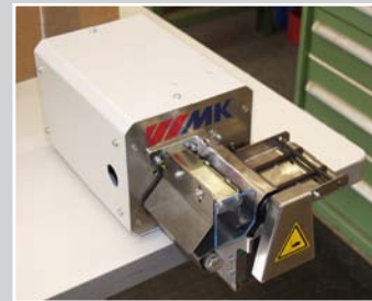
Bandschneidegerät 100/150 mm Doppelantrieb