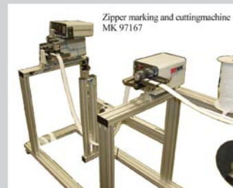
Zipper marking and cuttingmachine MK 97167 Scheideanlage mit pneumatischer Schere 100 mm zum Markieren und Schneiden von Reißverschlüssen mit Bandsponder und Tänzer auf Rollengestell