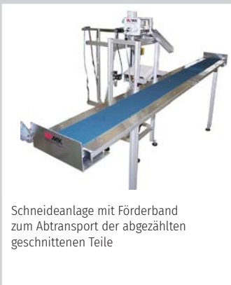
Schneideanlage mit Förderband zum Abtransport der abgezählten geschnittenen Teile