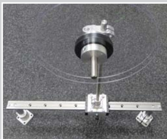
Bandrollenhalter verstellbar für Montage unter der Tischplatte